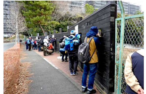
裏門公園での観察 湘爺

思いのほか陽射しが少なく、風が冷たい朝。それでもたくさんの方が参加され、いつものように、賑やかで、和やかな観察会です。植物はまだまだ数が少ないのですが、1月から健気に咲いている花々に、この時期咲き出す季節の花が加わって、「光の春」の半日を、のんびり楽しみました。