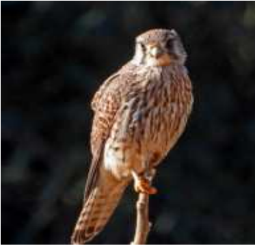
チョウゲンボウ 湘爺