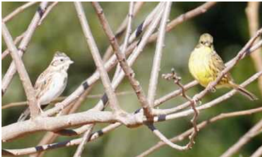
カシラダカとアオジ tomiko

見聞きした野鳥は以下の 24 種でした。メジロ、ハクセキレイ、スズメ、ツグミ、ハシボソガラス、モズ、シジュウカラ、ホオジロ、カシラダカ、ヒヨドリ、ヤマガラ、ウグイス、ジョウビタキ、アオゲラ、コゲラ、ノスリ、ハイタカ、キセキレイ、セグロセキレイ、アオジ、エナガ、カワラヒワ、キジバト、ムクドリ。