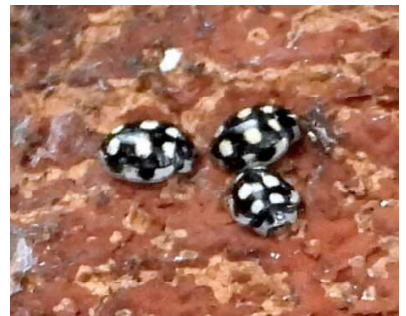
ウスキホシtentウ 湘爺

今日は虫をあまり見かけませんでしたね。今の時期あまり居ませんからね。ナナホシtentウ、フユシヤクの仲間、極小さなtentウムシの仲間。