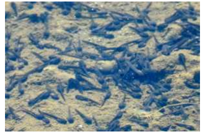
アズマヒキガエル 湘爺